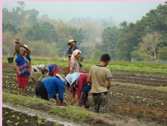
พื้นที่ทำกินที่มีเอกสารสิทธิ

ในชุมชนบ้านห้วยอีค่าง ยังคงสามารถเห็นชาวบ้านมีการช่วยเหลือเกื้อกูลกัน ถ้าคนไหนต้องลง ผักหรือเก็บผักในแปลง ชาวบ้านคนอื่นๆจะเข้ามาช่วยหรือเรียกว่า “ลงแขก” และวันต่อไปเป็นของ เพื่อนบ้านคนไหนก็จะหมุนเวียนเข้าไปช่วยเหลือกัน