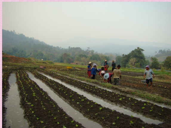
การทำเหมืองฝายเพื่อผันน้ำเข้านา

ประโยชน์จากเหมืองฝาย ได้เกิดการเกื้อกูลร่วมกันทั้งมนุษย์ ป่า พืช สัตว์ โดยความสัมพันธ์กัน ภายใต้วิถีการดำรงชีวิตแต่ละชีวิต ดังนี้