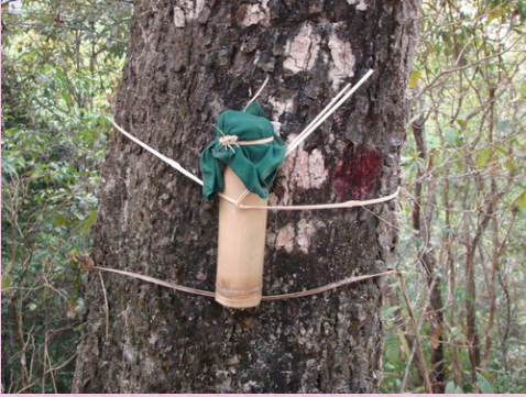
ป่าสะดือ