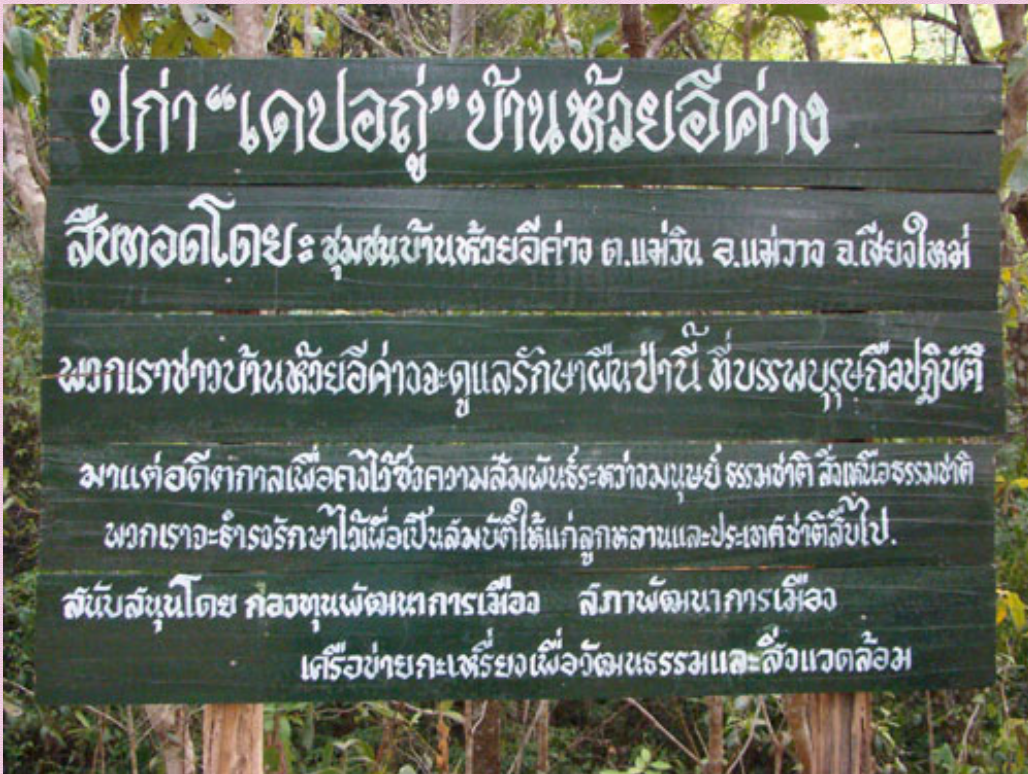
การติดป้ายแสดงถึงสิทธิในการดูแล รักษาป่าในหมู่บ้านห้วยอีค่าง เพื่อให้คนนอกรับทราบ

เป็นที่รู้จักกันในชุมชนว่าเป็นป่าสำหรับปกป้องรักษาไว้ แต่สามารถหากินของป่าประเภทต่างๆ ได้ เว้นแต่ห้ามไม่ให้ตัดต้นไม้ใหญ่ และบุกเบิกเป็นพื้นที่ทำกิน