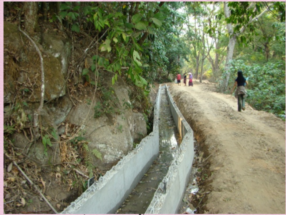
ลำรางที่ถูกสร้างขึ้นโดยชลประทาน

ดังนั้น การนำโครงการลงไปสู่ชุมชน โดยไม่เข้าใจในธรรมชาติและภูมิปัญญาท้องถิ่นที่ชาวบ้านเข้าใจในธรรมชาติ ย่อมส่งผลกระทบต่อวิถีความเป็นอยู่ของชุมชนเช่นกัน ภาพที่แสดงให้เห็นข้างต้น คงจะเข้าใจได้ดีว่า จะเกิดอะไรขึ้นในอนาคต เพราะตลอดเวลาลำรางของบ้านห้วยอีค่างไม่เคยแห้งแล้ง มีน้ำตลอดปี เพราะความอุดมสมบูรณ์ของผืนป่าและความเข้าใจวิถีการจัดที่คืออย่างเข้าใจธรรมชาติ บ้านห้วยอีค่างจึงเป็นพื้นที่ต้นน้ำที่อุดมไปด้วยลำรางถึง 4 สาย และไม่เคยเก็บกักน้ำไว้ในชุมชนเพราะจะส่งผลกระทบต่อพื้นที่ข้างล่างที่จะต้องประสบภาวะขาดแคลนน้ำ ดังนั้น โครงการที่ชลประทานเข้ามาดำเนินการ แม้จะเป็นโครงการขนาดเล็ก แต่เนื่องจากพื้นที่บ้านห้วยอีค่างเป็นชุมชนต้นน้ำ การทำโครงการเช่นนี้อาจส่งผลกระทบต่อโครงการปลายทางได้ ธรรมชาติของลำรางได้เปลี่ยนมาเป็นคอนกรีต จะมีน้ำตลอดปีหรือไม่