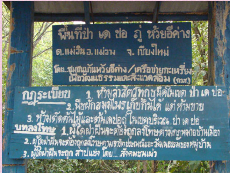
กฎระเบียบในการจัดการทรัพยากรป่าไม้ของหมู่บ้านห้วยอีค่าง

รวมทั้ง ในพื้นที่บ้านห้วยอีค่างมีลำเหมืองไรร่วมกัน ถึง 3 ลำเหมืองด้วยกัน พื้นที่จึงอุดมสมบูรณ์ไปด้วยน้ำในการทำการเกษตรกรรม โดยบ้านห้วยอีค่างมีกฎระเบียบของชุมชน ดังนี้