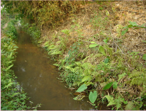
ลำรางเดิม