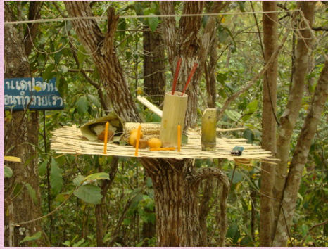
ป่าไช้สอย

ที่ดินที่ใช้เป็นพื้นที่ทำกิน พื้นที่ ทำกินที่เป็นที่นาหรือเป็นที่ราบลุ่มในบ้านห้วยอีค่าง เพิ่งจะ ได้รับเอกสารสิทธิโฉนดที่ดินเมื่อปี พ.ศ. 2551 ดังที่กล่าวมาแล้วข้างต้น แต่อย่างไรก็ตามแม้ว่าที่ดินทำ กินจะเป็นที่ดินของปัจเจกชน แต่คนในชุมชนยังคงมีการแบ่งปันกันใช้ประโยชน์ในที่ดินดังกล่าว โดย ถ้าที่ดินที่มีโฉนดแปลงใดไม่ได้ทำประโยชน์ คนในชุมชนสามารถเข้ามาขอใช้ประโยชน์ปลูกผักใน ระยะเวลาที่เจ้าของที่ดินไม่ได้ใช้ที่ดินก็ได้