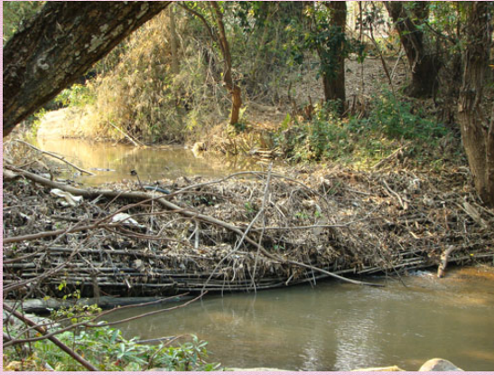
เหมืองฝาย