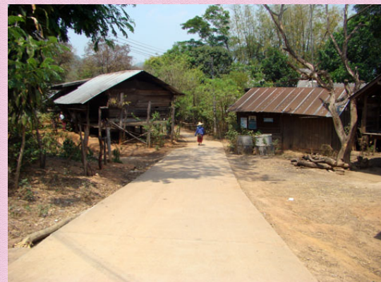
เส้นทางไปสู่อีค่าง

ภายใต้โครงการสังเคราะห์องค์ความรู้เพื่อจัดทำข้อเสนอแนะทางและมาตรการรับรองสิทธิชุมชนที่เป็นการปกป้องคุ้มครองสุขภาพของประชาชน, 2554 ภายใต้การสนับสนุนของ สำนักงานกองทุนสนับสนุนการสร้างเสริมสุขภาพและมูลนิธิธรรมาภิบาลแห่งชาติ