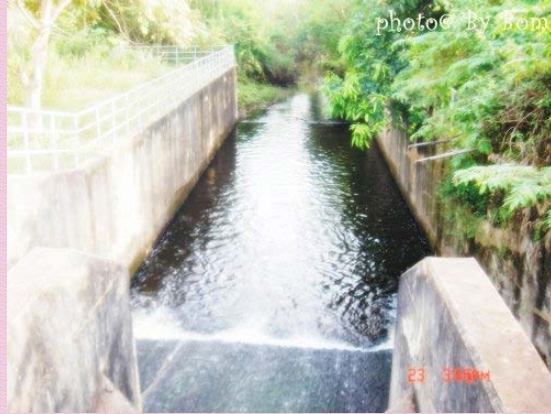
ฝายคอนกรีต